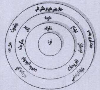
شکل ۱: کنش متقابل بین فرد، خانواده، سیستم های اجتماعی و جهان بینی های فرهنگی کلی

شکل (۱) مدل بوم شناختی را در فرایند مشاوره نشان می دهد. در این مدل، فرد در بافت خانواده و خانواده نیز در بافت نظام های اجتماعی بزرگتر نظیر مدرسه، محیط کار و جامعه مورد مطالعه قرار می گیرد. هم چنین خود این نظام های اجتماعی نیز در چارچوب سیستم های بزرگتر متشکل از نگرش ها، جهان بینی های فرهنگی، جنسیت، نژاد، طبقه اجتماعی، قومیت، مناطق جغرافیایی و سایر عوامل مورد بررسی قرار می گیرند. تمامی این سیستم ها با همدیگر تعامل دارند و روی یکدیگر تأثیر متقابل می گذارند.